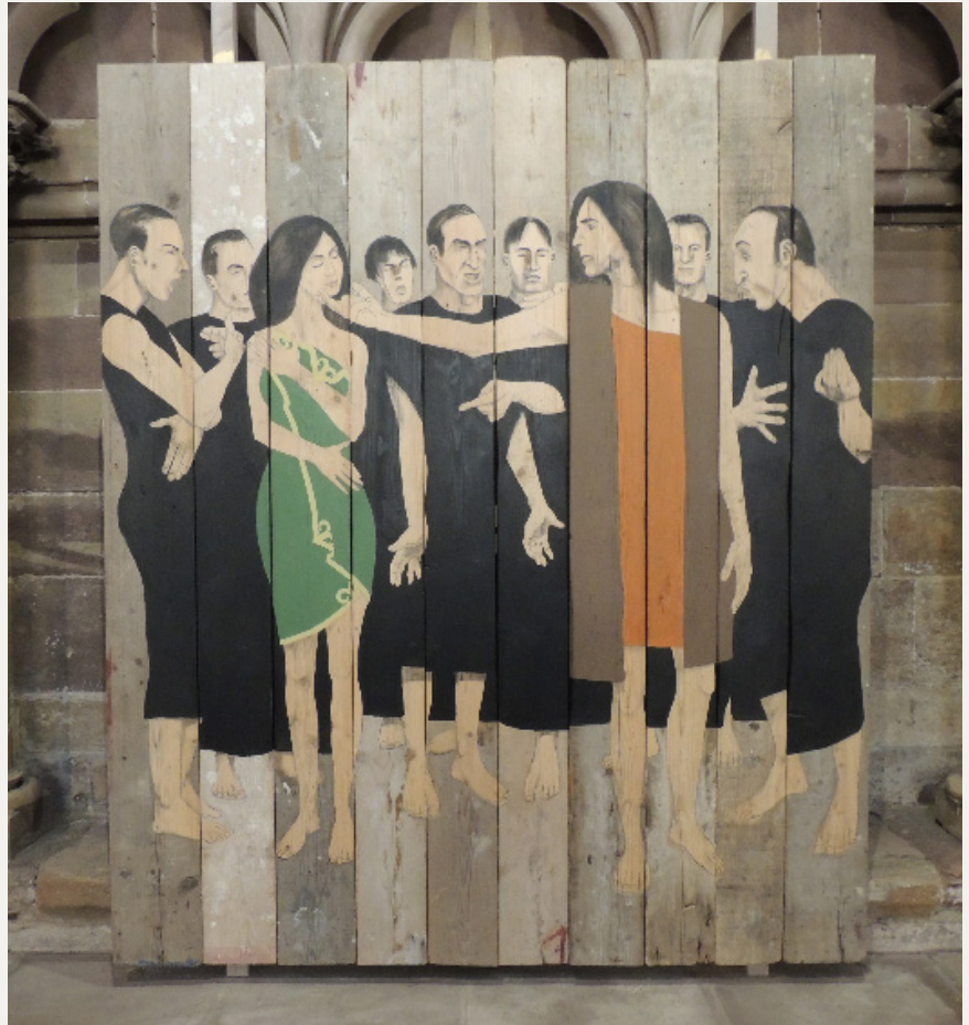
La femme adultère 2019

Le rabbi s'accroupit et dessine dans le sable. L'espace d'un instant, elle oublie la menace, et les hommes leur colère. Un simple geste de création stoppe net le tumulte de peur et de colère. Dans le silence revenu, la phrase du salut retentit : « Que celui qui n'a jamais péché lui jette la première pierre ».